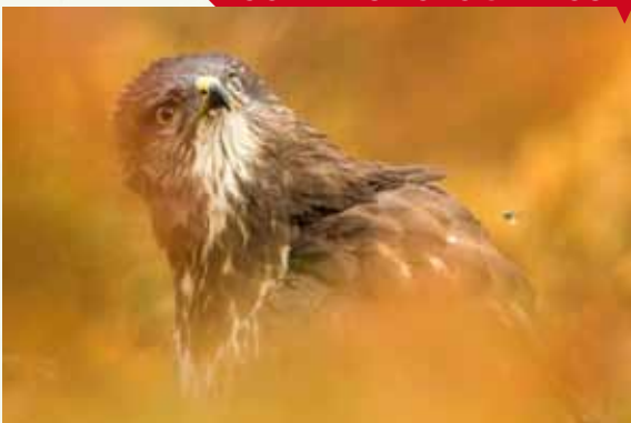
Alerta, de Marc Albiac