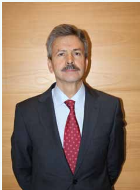
José Luis Navarro Consejero de Economía e Infraestructuras Junta de Extremadura

En esta edición, FIO está llena de novedades. Se ha creado una aplicación para móviles con toda la información de la feria. Por primera vez, hay wifi gratuito y cobertura 3G para facilitar el uso de Internet en todo el recinto. Han aumentado las actividades para el público, entre ellas, rutas guiadas, talleres infantiles, espectáculos de teatro y danza e incluso un dron que permitirá a los participantes ver Monfragüe a gran altura, como lo haría un águila imperial ibérica o un buitre negro.