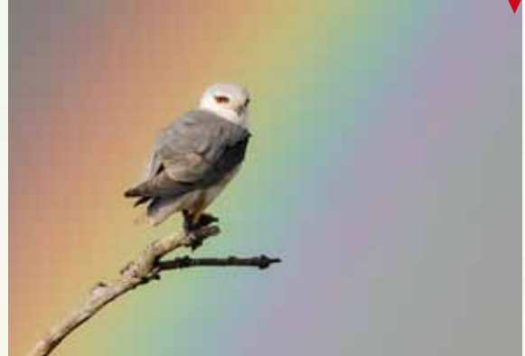
Elanio con arco iris, de Win Wirrelman