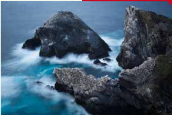
La roca de los alcatraces, de Felipe de Foncueva