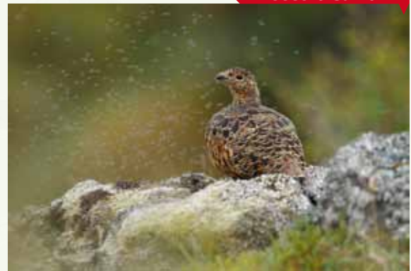
Mosquitos en la tundra, de José Luis Gómez de Francisco