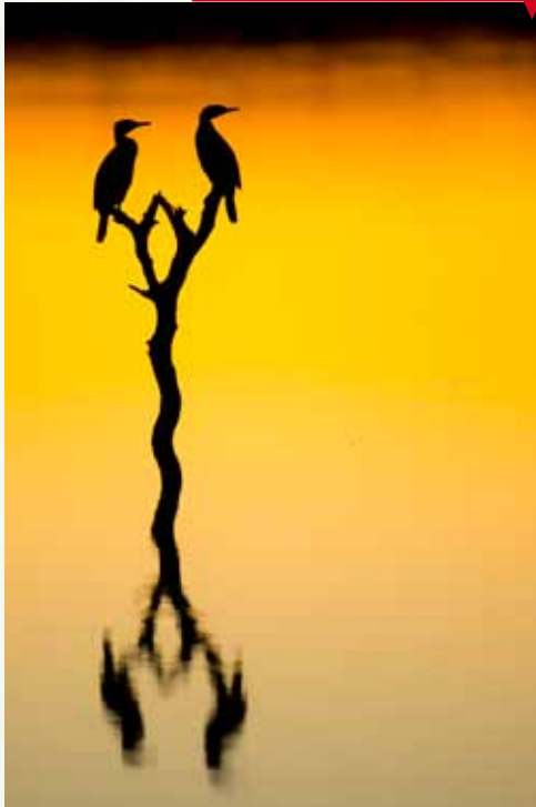
Mercido descanso, de Manuel Montero