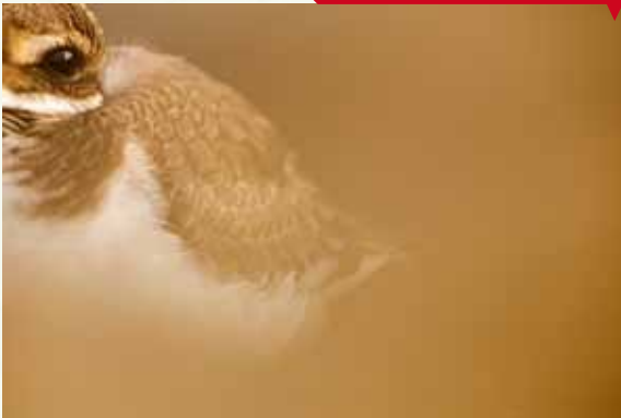
El ojo del chorlitejo, de Mario Suárez Porras