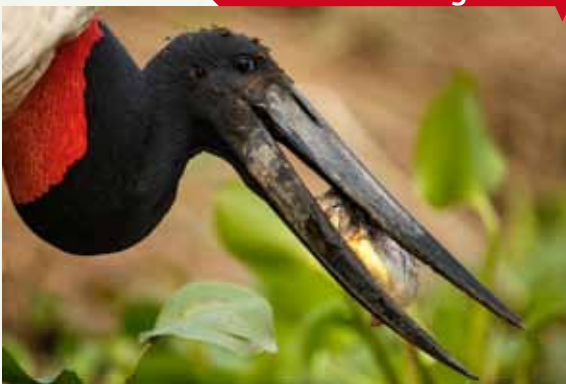
Quién a hierro mata..., de Santiago Suñer